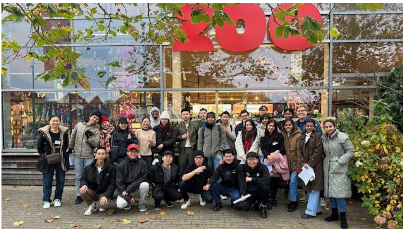
30 udenlandske praktikanter fra seks forskellige lande var samlet til weekend på Fyn. De fik undervisning i det danske arbejdsmarked, arbejdsmiljø og deres rettigheder. Og så fik de en rundtur i Odense Zoo. Arrangementet blev afholdt for andet år i træk, og det var arrangeret af 3F og GLS-A.

"Der burde være afsat langt flere penge til efter- og videreuddannelse af medarbejderne i landbruget og skovbruget... uden kvalificeret arbejdskraft bliver der ingen grøn omstilling."